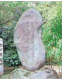
水前寺・江津湖の 周辺学の 碑