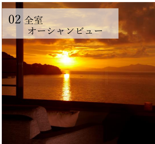
02 全室 オーシャンビュー