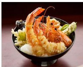
えび庵 足赤海老天丼