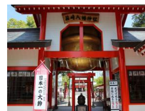
出水市 箱崎八幡神社 日本一の大鈴・小鈴