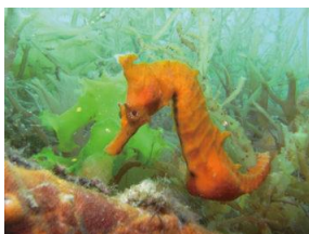
不知火海ダイビング 新種のヒメタツ生息地