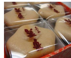
柳屋本舗 美貴もなか