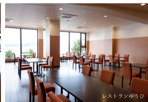
レストランゆうひ