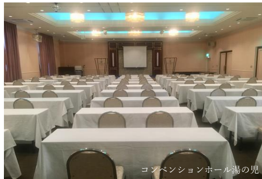
コンベンションホール湯の児