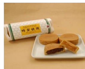
水俣発祥 蜂蜜饅頭