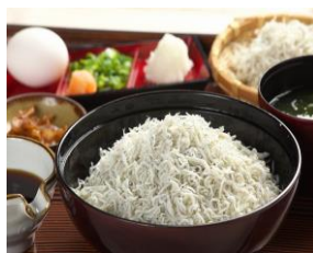
貝汁処 南里 しらす丼