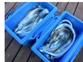
湯の児名物 太刀魚釣り （4月～11月）