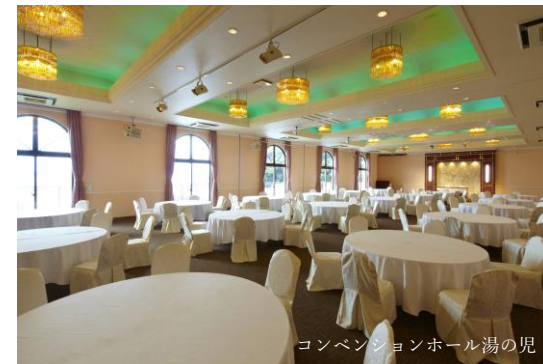
コンベンションホール湯の児