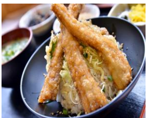
たばくまん 芦北名物太刀魚丼