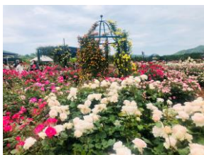
エコパーク水俣 バラ園約600種4,000本（春・秋）