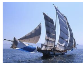
芦北うたせ船 （5月～10月）