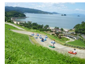
芦北海浜総合公園 ローラーリュージュ