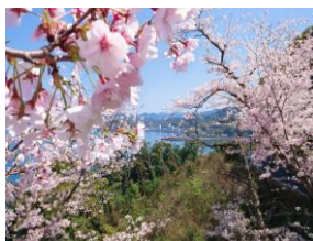
チェリーライン（4月頃）